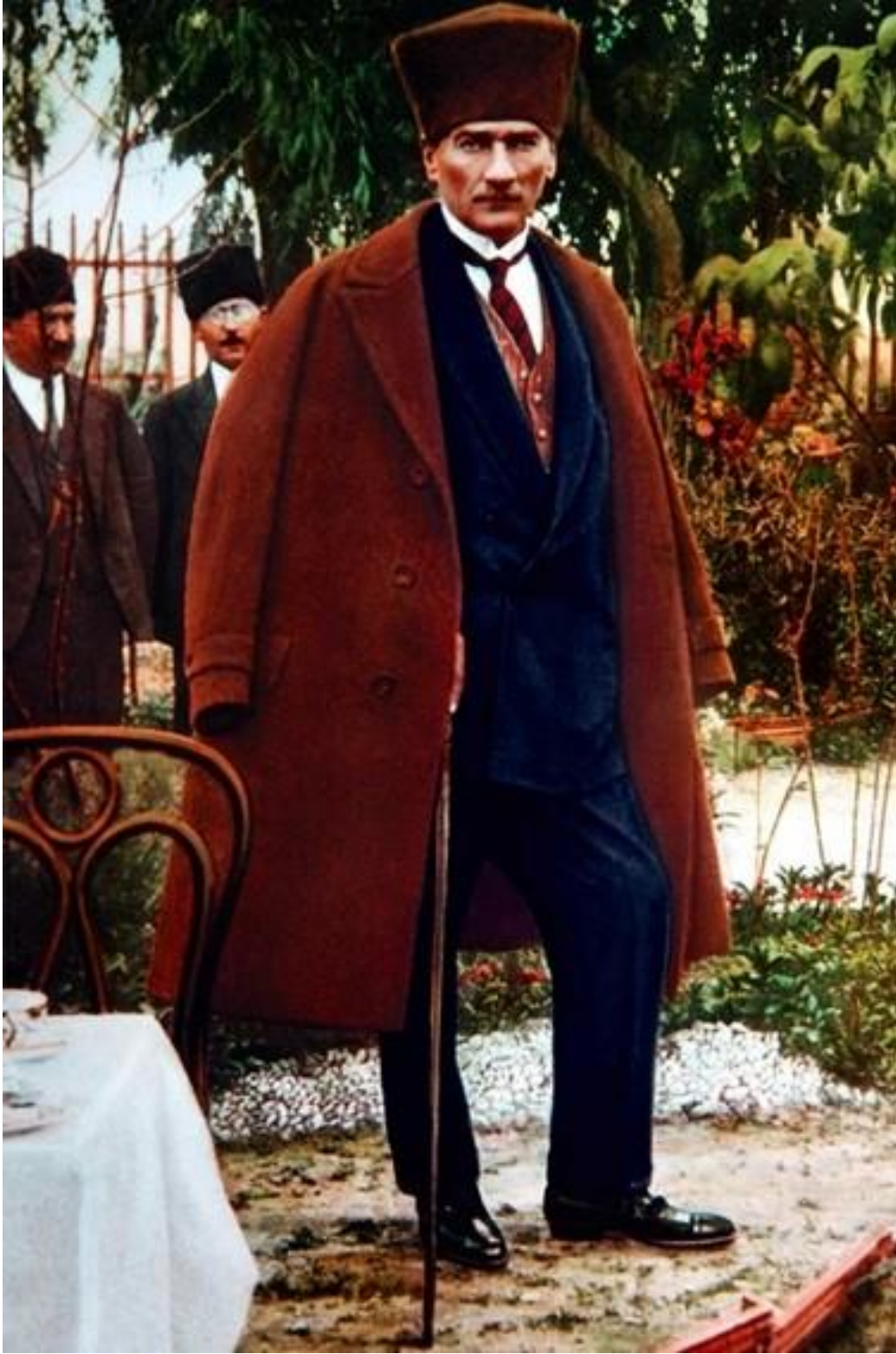
- Mustafa Kemal ATATÜRK Tarsus Şelalesinde

Eğitimidir ki, bir milleti ya özgür, bağımsız, şanlı, yüksek bir topluluk halinde yaşatır; ya da esaret ve sefaletle terk eder.